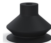
Referência da variação: 8SB 40NI A