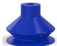
Referência da variação: 8SB 40TPUB A