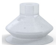
Referência da variação: 8SB 40SLT A