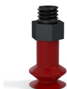
Riferimento variante: 91 08SL M5M