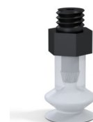
Riferimento variante: 91 08SLT M5M