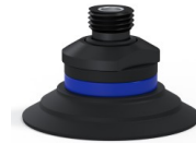
Référence déclinaison : 9 50NI 14D-2-PAL