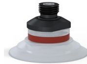
Référence déclinaison : 9 50SLT 14D-2-PAL