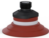
Référence déclinaison : 9 50SL 14D-2-PAL