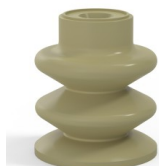
Référence déclinaison :