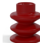
Référence déclinaison :