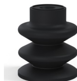
Référence déclinaison :