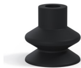
Référence déclinaison : 1 27NI A