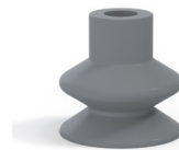
Référence déclinaison : 1 27NR A