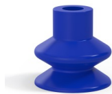
Référence déclinaison : 1 27PU A