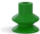
Référence déclinaison : 1 27SLV A