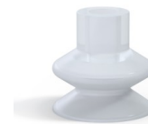
Référence déclinaison : 1 27SLT A