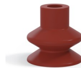
Référence déclinaison : 1 27SL A