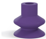
Référence déclinaison : 1 27MNT A