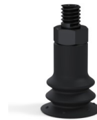
Referencia de la variante: 96 15NI M5