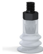
Referencia de la variante: 96 15SLT M5