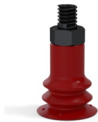
Referencia de la variante: 96 15SL M5