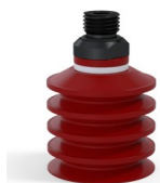
Referencia de la variante: 92 40SL 14D-2-GIC