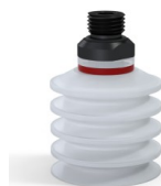
Referencia de la variante: 92 40SLT 14D-2-GIC