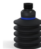
Referencia de la variante: 92 40NI 14D-2-GIC