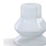
Referencia de la variante: 8 13SLT A