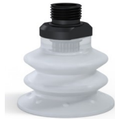
Variantenreferenz: 96 52SLT 38D-2