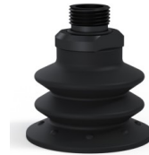
Variantenreferenz: 96 52NI 38D-2