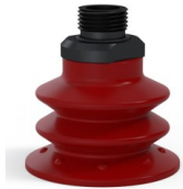
Variantenreferenz: 96 52SL 38D-2