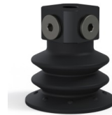
Variantenreferenz: 96 52NI 18D-3-BD