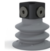
Variantenreferenz: 96 52NR 18D-3-BD