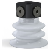
Variantenreferenz: 96 52SLT 18D-3-BD