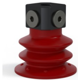
Variantenreferenz: 96 52SL 18D-3-BD