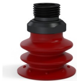
Variantenreferenz: 96 35SL 38D-2