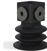
Variantenreferenz: 96 35NI 18D-3-BD