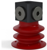
Variantenreferenz: 96 35SL 18D-3-BD