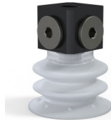
Variantenreferenz: 96 35SLT 18D-3-BD