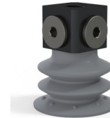
Variantenreferenz: 96 35NR 18D-3-BD