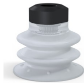
Variantenreferenz: 96 35SLT 18D-2