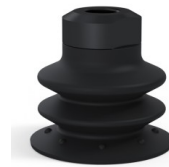
Variantenreferenz: 96 35NI 18D-2