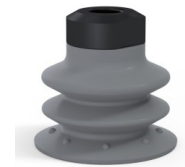
Variantenreferenz: 96 35NR 18D-2