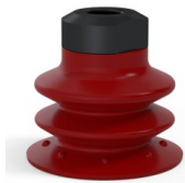
Variantenreferenz: 96 35SL 18D-2