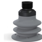
Variantenreferenz: 96 35NR 14D-2-GIC