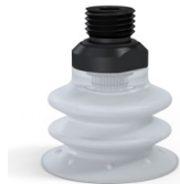
Variantenreferenz: 96 35SLT 14D-2-GIC