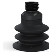
Variantenreferenz: 96 35NI 14D-2-GIC