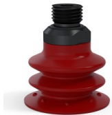
Variantenreferenz: 96 35SL 14D-2-GIC