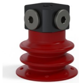
Variantenreferenz: 96 25SL FM5BD