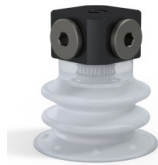
Variantenreferenz: 96 25SLT FM5BD