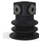
Variantenreferenz: 96 25NI FM5BD