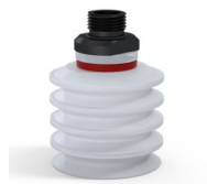
Variantenreferenz: 92 50SLT 38D-2-GIC