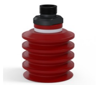
Variantenreferenz: 92 50SL 38D-2-GIC