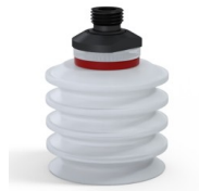
Variantenreferenz: 92 50SLT 14D-2