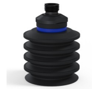
Variantenreferenz: 92 50NI 14D-2