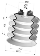
Sauggreifer 4.5 Falten Serie 92 Ø 40MM