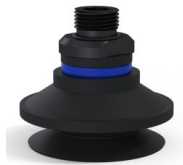
Variantenreferenz: 91 50NI 38D-2-GIC