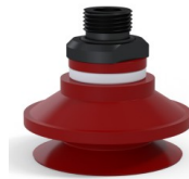
Variantenreferenz: 91 50SL 38D-2-GIC