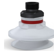
Variantenreferenz: 91 50SLT 38D-2-GIC