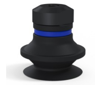
Variantenreferenz: 91 20NI FM5GIC