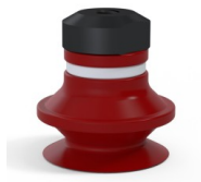
Variantenreferenz: 91 20SL FM5GIC