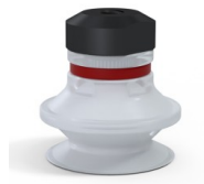
Variantenreferenz: 91 20SLT FM5GIC