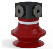
Variantenreferenz: 91 20SL FM5BD