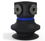
Variantenreferenz: 91 20NI FM5BD