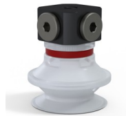
Variantenreferenz: 91 20SLT FM5BD