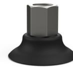
Variantenreferenz: PFTF 40NI 1/4