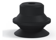
Variantenreferenz: PBG 20NI A