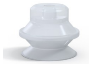
Variantenreferenz: PBG 20SLT A