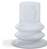
Variantenreferenz: 96 15SLT A