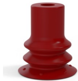
Variantenreferenz: 96 15SL A