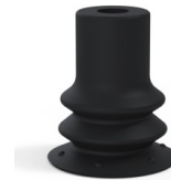
Variantenreferenz: 96 15NI A