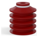
Variantenreferenz: 92 40SL A