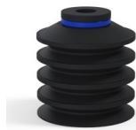
Variantenreferenz: 92 40NI A