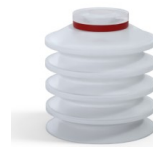
Variantenreferenz: 92 40SLT A