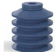
Variantenreferenz: 92 40SLDB A SH60