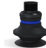
Variantenreferenz: 91 20NI M18D