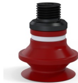
Variantenreferenz: 91 20SL M18D