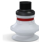
Variantenreferenz: 91 20SLT M18D