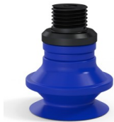
Variantenreferenz: 91 20PU M18D