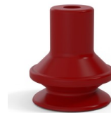
Variantenreferenz: 91 16SL A