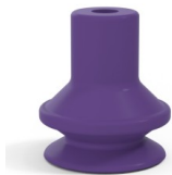
Variantenreferenz: 91 16MNT A