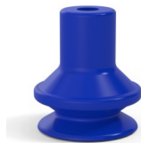
Variantenreferenz: 91 16PU A