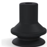
Variantenreferenz: 91 16NI A