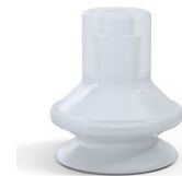
Variantenreferenz: 91 16SLT A