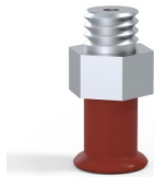
Variantenreferenz: 9 07SL M5M