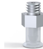
Variantenreferenz: 9 07SLT M5M