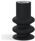
Variantenreferenz: 8B 30NI F14 • Farbe: Schwarz • Materiale: Nitril