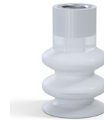
Variantenreferenz: 8B 30SLT F14 • Farbe: Transluzent • Materiale: Silikon