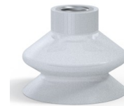
Variantenreferenz: 8A 44SLT F14