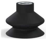
Variantenreferenz: 8A 44NI F14