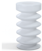
Variantenreferenz: 83 25SLT A