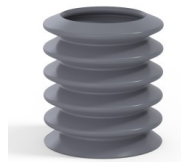
Variantenreferenz: 81 36SLDG A