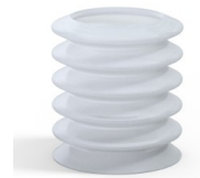
Variantenreferenz: 81 36SLT A SH40