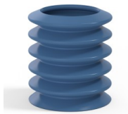
Variantenreferenz: 81 36SLBLEU A SH30