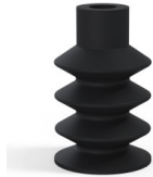
Variantenreferenz: 81 18NI A