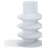
Variantenreferenz: 81 18SLT A