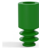
Variantenreferenz: 8 04SLV A