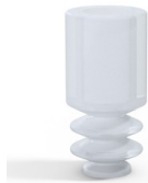
Variantenreferenz: 8 04SLT A