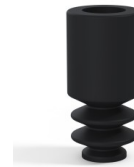
Variantenreferenz: 8 04NI A