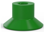
Variantenreferenz: 75 25CN A