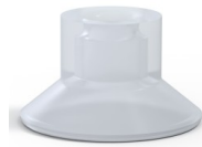
Variantenreferenz: 75 25SLT A