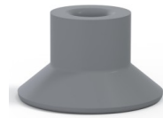
Variantenreferenz: 75 25NR A