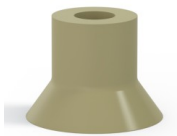
Variantenreferenz: 73 40CN A