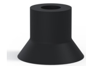
Variantenreferenz: 73 40NI A