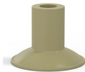
Variantenreferenz: 7 26CN A