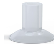
Variantenreferenz: 7 26SLT A