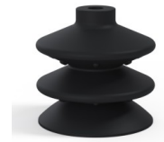
Variantenreferenz: 2 87NI A