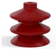
Variantenreferenz: 2 87SL A