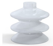
Variantenreferenz: 2 87SLT A