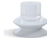
Variantenreferenz: 1 32SLT A