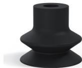
Variantenreferenz: 1 32NI A