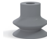
Variantenreferenz: 1 32NR A