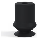
Variantenreferenz: 1 10NI A