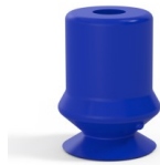
Variantenreferenz: 1 10PU A