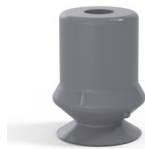
Variantenreferenz: 1 10NR A