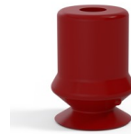
Variantenreferenz: 1 10SL A