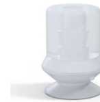
Variantenreferenz: 1 10SLT A