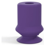
Variantenreferenz: 1 10MNT A