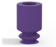
Variantenreferenz: 1 05MNT A