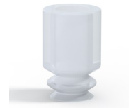
Variantenreferenz: 1 05SLT A