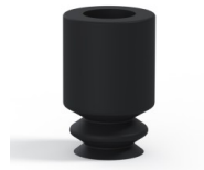
Variantenreferenz: 1 05NI A