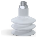
Variantenreferenz: 8B 50SLT M14