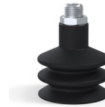
Variantenreferenz: 8B 50NI M14