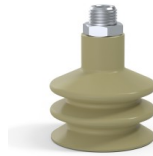
Variantenreferenz: 8B 50CN M14