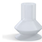
Variantenreferenz: 83 16SLT A