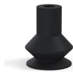
Variantenreferenz: 83 16NI A