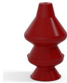
Variantenreferenz: 81 30SL A