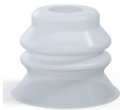
Variantenreferenz: 81 60SLT A