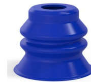
Variantenreferenz: 81 60SLBLEU A