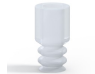
Variantenreferenz: 2 06-2SLT A