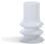
Variantenreferenz: 88B 20SLT A SH40