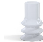
Variantenreferenz: 88B 20SLT A