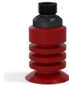
Variantenreferenz: 95-2 30SL 14D-2