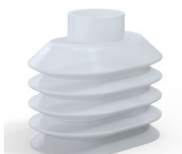
Variantenreferenz: 4PA56 38 50SLT A