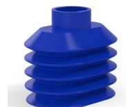
Variantenreferenz: 4PA56 38 50SLBLEU A