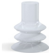
Variantenreferenz: 88B 40SLT A